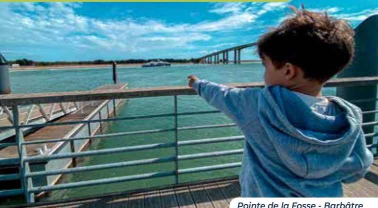
Pointe de la Fosse - Barbâtre

Compagnie Vendéenne vous propose en juillet et août 2024 des départs de La Pointe de La Fosse au pied du pont, sur l'Île de Noirmoutier.