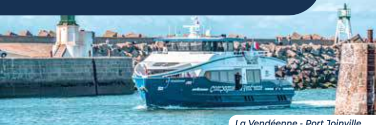
La Vendéenne - Port Joinville

i Il est fortement recommandé d'effectuer les réservations à l'avance. La réservation est effective à la perception de la totalité du règlement.