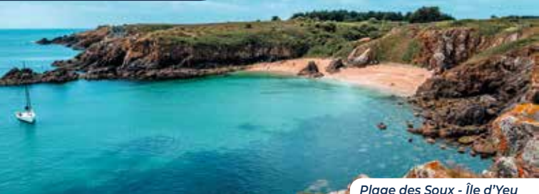
Plage des Soux - Île d'Yeu